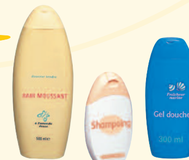
Flacons de champings et gels douche