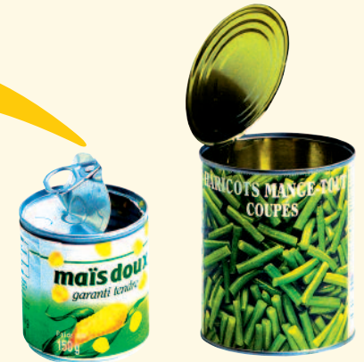
Boîtes en fer : bidons de sirop, aérosols, boîtes de conserve