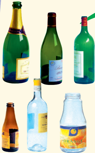
Bouteilles et flacons