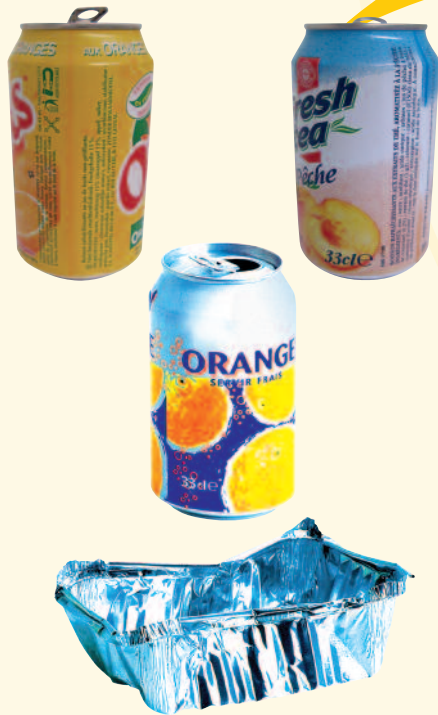
Boîtes, cannettes et barquettes en aluminium