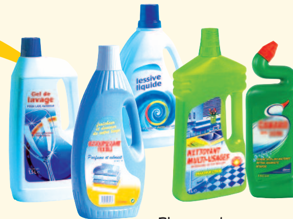
Flacons de produits ménagers