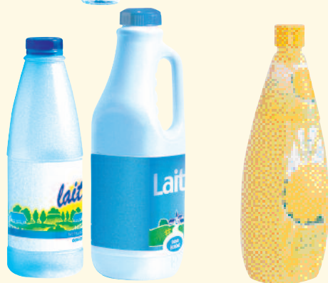
Bouteilles d'eau, de jus de fruit, de soda, de lait, de soupe, d'huile