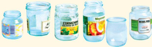
Pots et bocaux