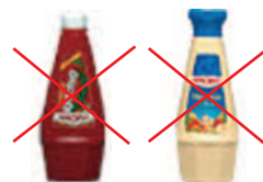
Tubes de corps gras