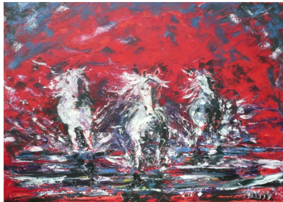
Le grand Galop n°2 Rémy Boissy