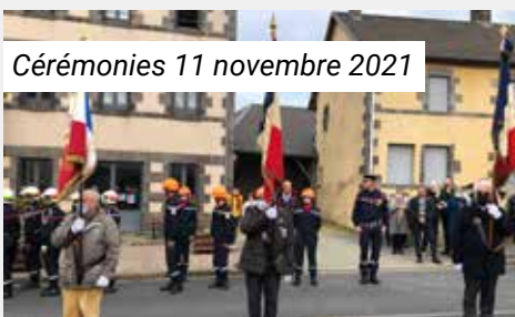
Cérémonies 11 novembre 2021

Rappel : les associations doivent informer la mairie de leur Assemblée Générale et fournir les renseignements suivants : adresse du siège de l'association et liste des membres du bureau.