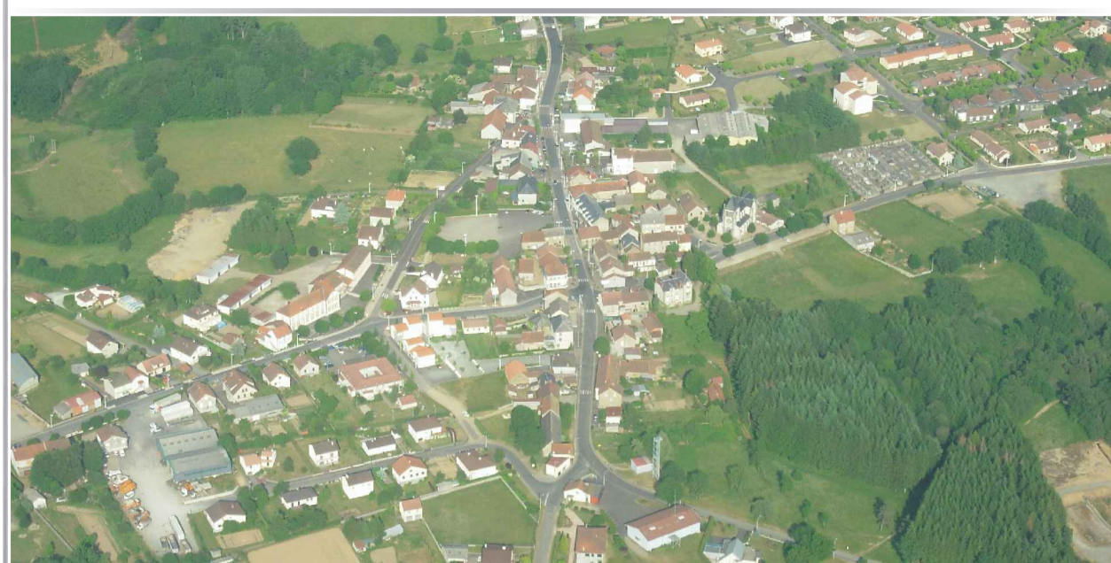
Planche Nord - Echelle : 1/5000

Plan local d'urbanisme : Mise en révision du POS entraînant l'élaboration du Plan Local d'Urbanisme par délibération du Conseil Municipal en date du 21 novembre 2008.